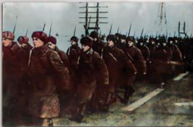
Бойцы добровольцы выходят на юго-западные рубежи обороны Москвы

15 ноября 1941 года по приказу командующего войсками Московского военного округа, 2 отдельная бригада московских рабочих была переформирована в 5 Московскую стрелковую дивизию.