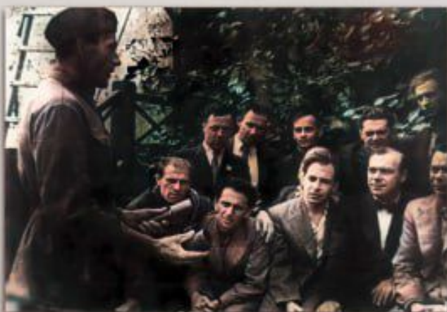
Бойцы истребительного батальона Свердловского района г. Москвы изучают устройство ручных гранат

В июне – начале июля 1941 года из лиц, не подлежащих по разным причинам призыву в армию, из добровольцев были созданы 87 истребительных батальонов общей численностью 28.500 человек. Командный состав батальонов был набран из кадровых военнослужащих и сотрудников системы НКВД СССР.