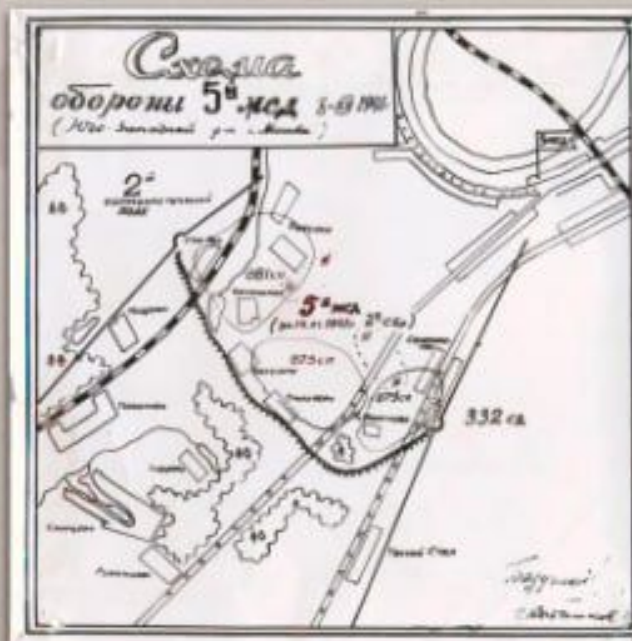
Схема обороны 5-й Московской стрелковой дивизии

12 октября 1941 года в связи с приближением фронта к столице, решением Государственного комитета обороны СССР была создана система рубежей обороны Москвы, разделенных на участки. 3, 4 и 5 стрелковые полки истребительных батальонов заняли боевой участок №3, перехватывающий район Можайского, Наро-Фоминского, Малоярославецкого шоссе, от Кунцева до Люберец.