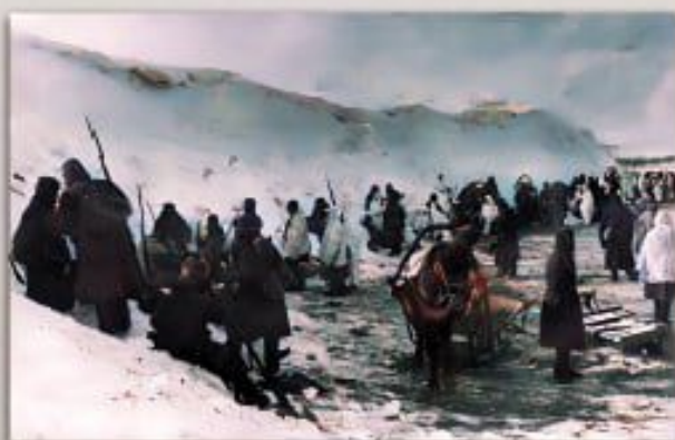
Ближний тыл под Холмцеом