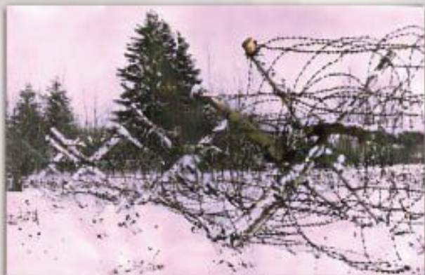
Заграждение по Холмцеом