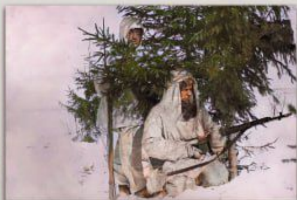
Снайперы у д. Жиганово