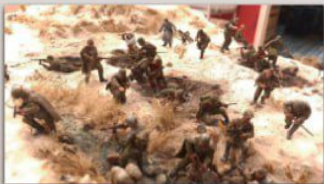
Бой в деревне Жиганово (реконструкция)

21.02.42 г. отдано распоряжение о начале боевых действий. 158 с.д. с утра атакует Холмец и прилегающие высоты. В упорных боях 875 и 879 с.п. захватили населенные пункты: Кузнецово, Безобразово, Высокое, Морщиково, Созоново, Л. Фабрика, Васильки. Бои за основной узел сопротивления Холмец-Макарово успеха не имели. Части отошли на исходное положение.