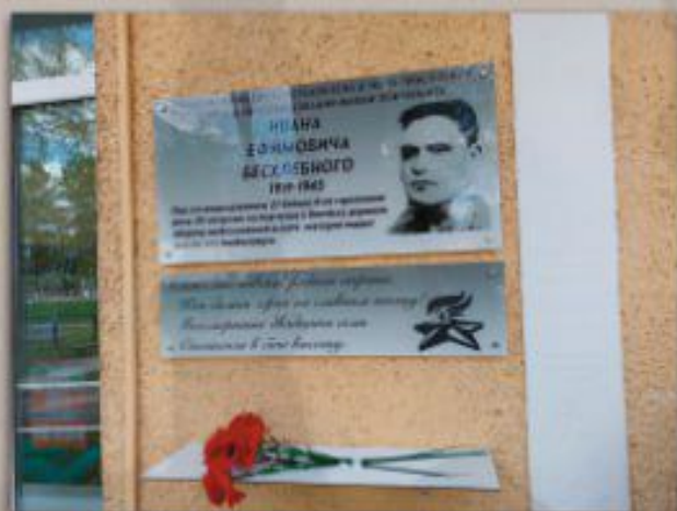
Мемориальная доска на здании ГУО «Вороновская средняя школа Витебского района имени И. Е. Бесхлебного».