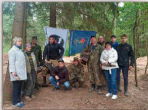
Участники международной Вахты Памяти «Погостино-43».

В декабре 1943 года части 158 стрелковой дивизии подошли к укрепленному рубежу немцев у автомагистрали Смоленск — Витебск. Утром 25 декабря подразделения 875 стрелкового полка прорвали линию обороны врага у деревни Ковширы. Дальнейшему продвижению мешал опорный пункт противника на высоте Безымянной у д. Дрюково.