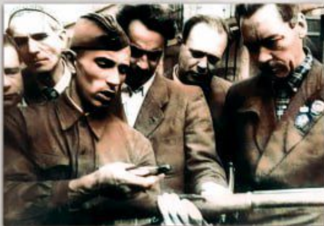
Бойцы истребительного батальона Свердловского района г. Москвы на стрелковой подготовке

В июне – начале июля 1941 года из лиц, не подлежащих по разным причинам призыву в армию, из добровольцев были созданы 87 истребительных батальонов общей численностью 28.500 человек. Командный состав батальонов был набран из кадровых военнослужащих и сотрудников системы НКВД СССР.