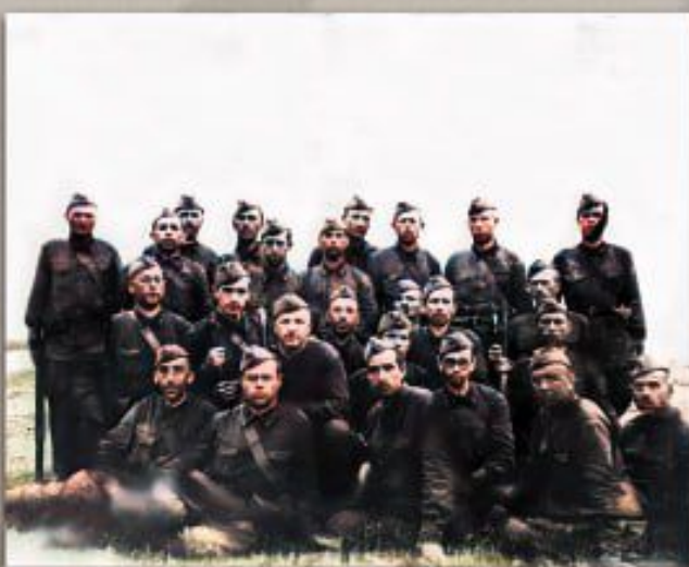
Взвод 3 роты истребительного батальона

Истребительный батальон Свердловского района столицы укомплектовали добровольцами Московского тормозного завода, служащими Госплана СССР, сотрудниками Прокуратуры СССР; работниками Наркомата лесной промышленности СССР, редакции и типографии газеты «Известия», а также других центральных печатных изданий. К ним присоединились артисты театров, добровольцы учреждений культуры, госорганов и научных учреждений.