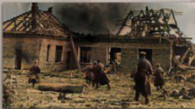
Бои за Лиозно

Вслед за районным центром Лиозно в результате кровопролитных боев войсками Красной Армии была освобождена еще часть населенных пунктов Лиозненского района, после чего наступление советских войск завершилось и началось затяжное 9-месячное противостояние.