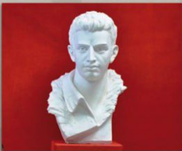
Бюст Абрама Левина

В 22.30 в части 158 с.д. отдан приказ о передаче обороны частям 186 с.д. Дивизия оставляет на рубеже обороны гарнизоны 879 с.п. и уходит в резерв для пополнения. На гарнизон Подсосенники в 11 человек наступало до батальона пехоты с танком, на гарнизон Жиганово в 14 человек - до двух рот с двумя танками, на Комары-Бабаево до батальона пехоты. Бойцы гарнизонов держались свыше суток. Из 74 человек осталось только 22.