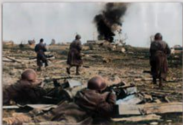
Бойцы 875 и 879 полков освобождают белорусский город Лиозно

Бои за освобождение Лиозно продолжались с 7 по 10 октября 1943 года. Приказом Верховного Главнокомандования от 10 октября 1943 года пяти воинским частям и соединениям, которые отличились при освобождении Лиозно, было присвоено почетное наименование «Лиозненский». Среди них была 158 стрелковая дивизия.