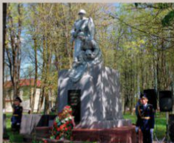
Воинское захоронение советских солдат № 4391 в агрогородке Вороны.

В боях за освобождение д. Вороны и окрестностей погибли 3.582 воина Красной Армии, которые захоронены в братской могиле, расположенной на территории деревни.