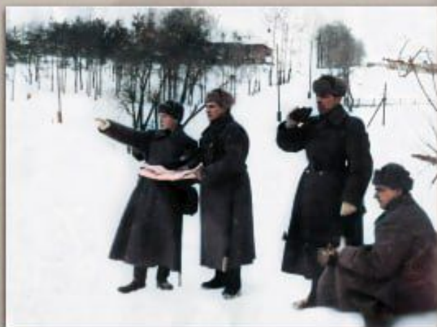
Командиры 5 Московской стрелковой дивизии изучают местность. Река Очаковка. Ноябрь-декабрь 1941 г.

В ходе обороны Москвы 5-я Московская стрелковая дивизия фактически не вступала в прямые столкновения с противником, за исключением отдельных эпизодов. По приказу Народного комиссара обороны СССР от 15 января 1942 года, дивизия была включена в состав Красной Армии с сохранением ее прежнего наименования – «5 Московская стрелковая дивизия».