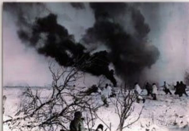
Подразделение 881-го полка штурмует немецкую оборону