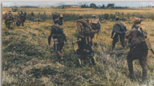
Пулеметная рота 881 полка выходит на огневую позицию

Летом 1944 года происходило важное сражение за освобождение крупного административного и промышленного центра Белорусской ССР – города Витебска – в ходе Белорусской стратегической наступательной операции «Багратион».