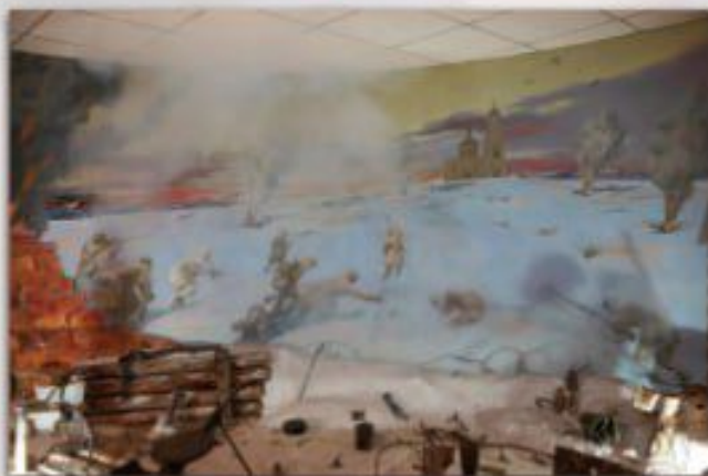
Диорама боя за Холмец