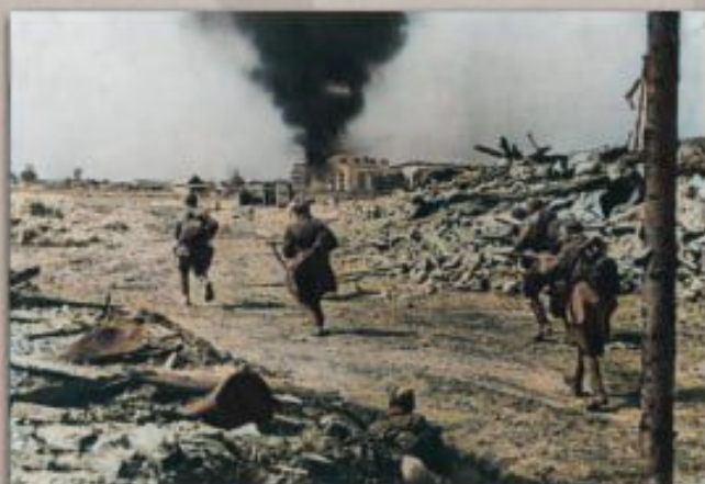
Атака советских войск на окраине Витебска

Непосредственно освобождение города было проведено 158 стрелковой дивизией 39 Армии.