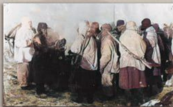
Раздача питания на передовой

В феврале – марте 1942 года окрестные деревни близ села Холмец неоднократно переходили из рук в руки. 3-4 марта 1943 село Холмец и весь Оленинский район были полностью освобождены.