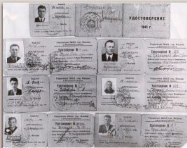
Фотографии удостоверений бойцов истребительных батальонов

15 ноября 1941 года по приказу командующего войсками Московского военного округа, 2 отдельная бригада московских рабочих была переформирована в 5 Московскую стрелковую дивизию.